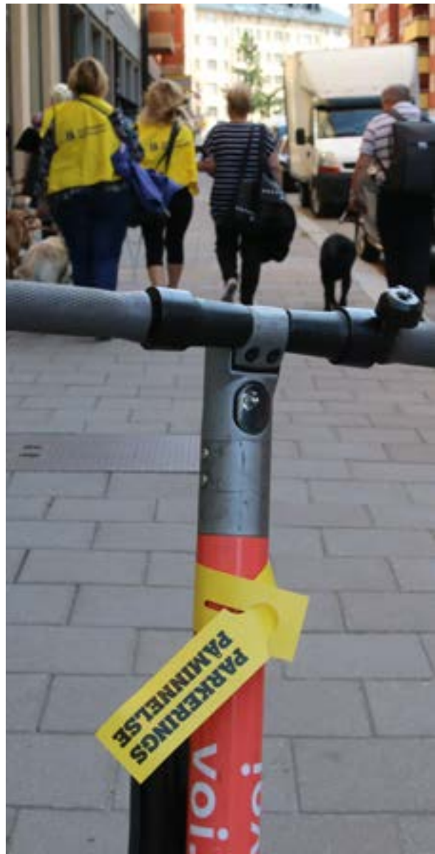
Den 14 augusti genomförde vi en aktion där vi lappade felparkerade elsparkcyklar på Södermalm i Stockholm.