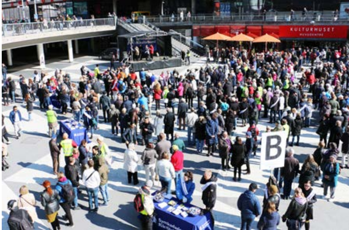
vänster: Manifestationen för rätten till ledsagning på Sergels torg i Stockholm. På en scen talades om ledsagning och där fanns informationsbord och allmänheten kunde prova på att bli ledsagade.