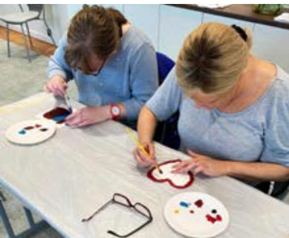
ovan: En helg i september ordnades en träff för synskadade med neuropsykiatriska funktionshinder på Almåsa havshotell. En viktig del av programmet var erfarenhetsutbyte. Man hann också med att göra collage av taktilt material och skulpturer av frigolit och gips.